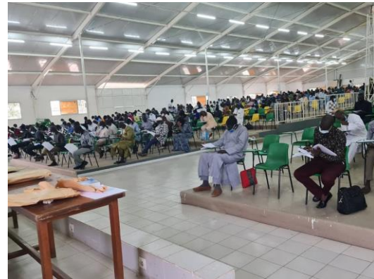
Les candidats planchant sur l'épreuve de synthèse dans le chapiteau de la fac de droit de l'UCAD