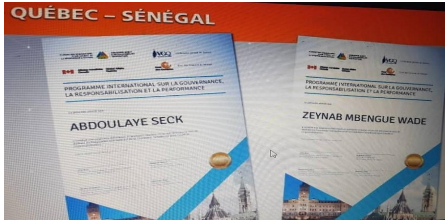
Les diplômes des deux boursiers de la Cour des Comptes

orientation stratégique majeure de la Cour consistant à donner une place plus importante à l'audit de performance qui favorise la transparence, l'efficacité, la responsabilisation et la gouvernance dans la gestion des ressources publiques et la fourniture de services de qualité aux citoyens.