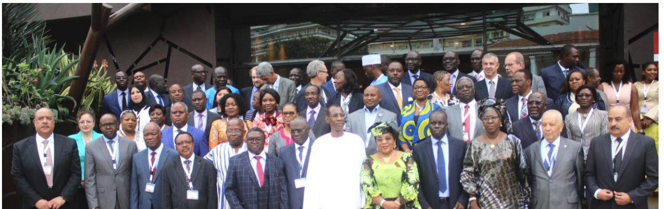
Le Comité Directeur de l'AFROSAI au complet, lors de sa réunion en aout 2019 à Dakar posant avec le ministre sénégalais des Finances et du budget, M Abdoulaye Daouda DIALLO

Après la vérification du quorum, le Comité directeur a examiné les points inscrits à l'ordre du jour parmi lesquels les défis liés à l'organisation de la 15 ème Assemblée Générale dans un contexte marqué par la Covid 19, la désignation de l'ISC africaine hôte du 25 ème INCOSAI et l'état d'avancement des groupes de travail (révision des statuts, élaboration du Plan stratégique de l'AFROSAI).