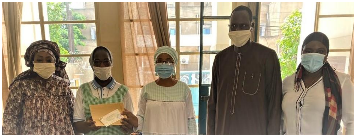
Le Président de l'Amicale en compagnie des représentantes des dames de la Cour posant avec la sœur Responsable de la Pouponnière

Il est important de souligner que le don des dames est issu de leurs cotisations personnelles et d'une quête auprès du personnel de la Cour. Bravo et félicitations aux dames de la Cour.