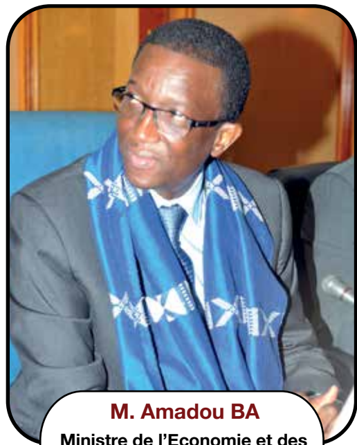
M. Amadou BA Ministre de l'Economie et des Finances du Sénégal

Permettez-moi, en cette, circonstance, de saluer et d'adresser mes vifs remerciements aux Conseillers de la Cour des Comptes de l'UEMOA et aux Présidents des juridictions financières. Nous sommes honorés du choix que vous avez bien voulu porter sur Dakar pour abriter cette importante rencontre.