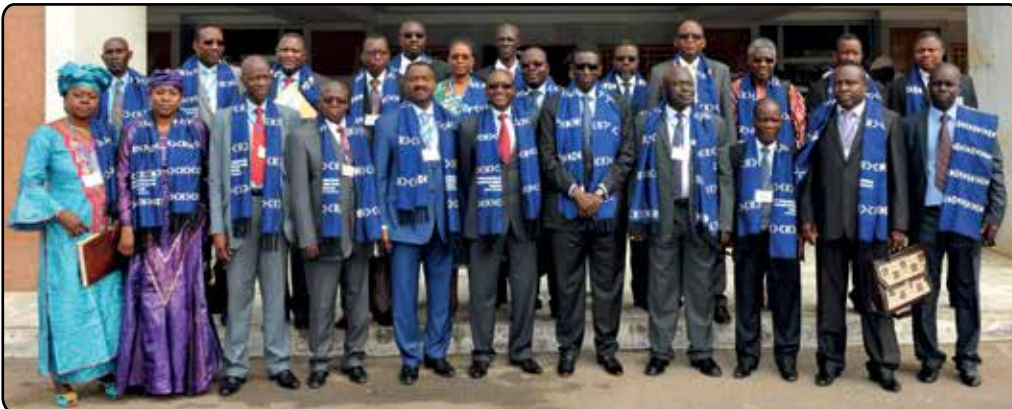
La photo de famille de la 16ème rencontre annuelle des Présidents des Cours des Comptes et des Conseillers à la Cour des Comptes de l'UEMOA