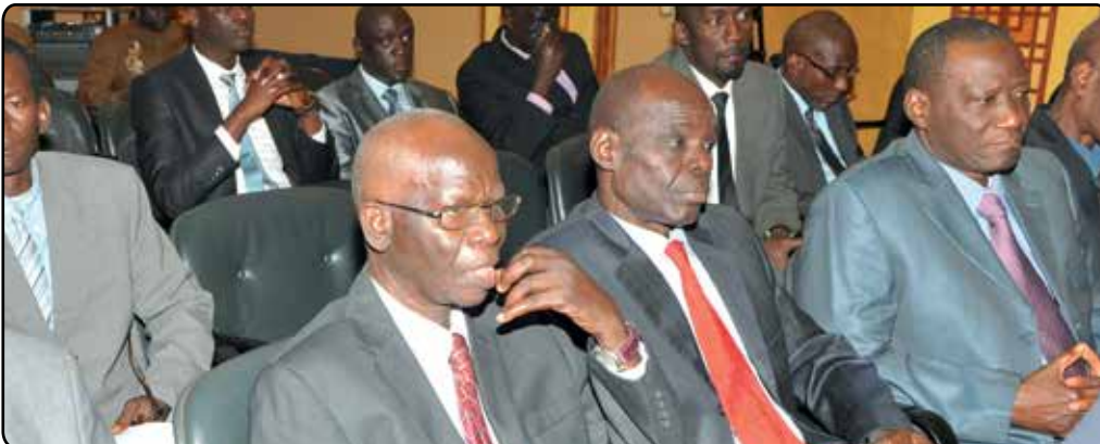
D'anciens employés supérieurs de la Cour des Comptes du Sénégal ont honoré de leur présence la cérémonie d'ouverture des travaux