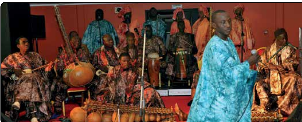
Une partie de l'ensemble lyrique de Sorano en pleine prestation lors du dîner de gala