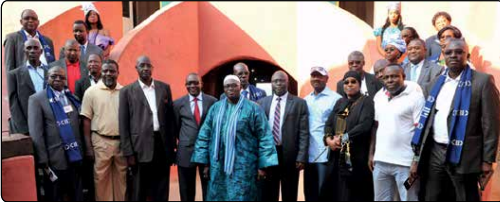
Visite à l'Île de Gorée