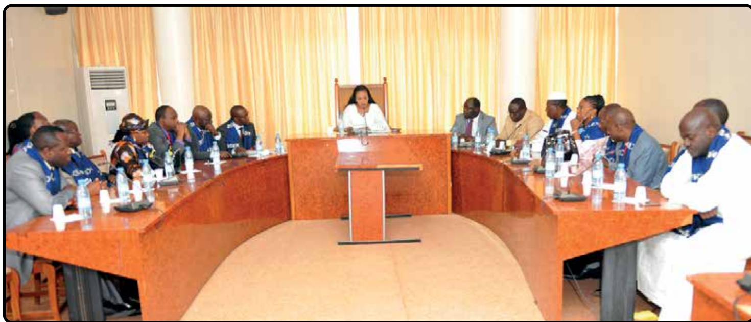
Audience des chefs de Cours à l'Assemblée Nationale avec la Première Vice-Présidente