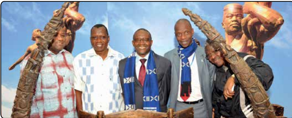
Visite au Monument de la Renaissance Africaine