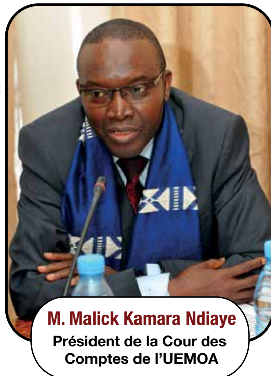
M. Malick Kamara Ndiaye Président de la Cour des Comptes de l'UEMOA

Pour cette raison, la Cour des Comptes de l'UEMOA avait tenu, à la suite de votre brillante nomination, à vos fonctions actuelles, à vous adresser ses vives félicitations, convaincue que, la grâce du Tout Puissant aidant, vous saurez remplir vos nouvelles fonctions avec toute la réussite qui sied