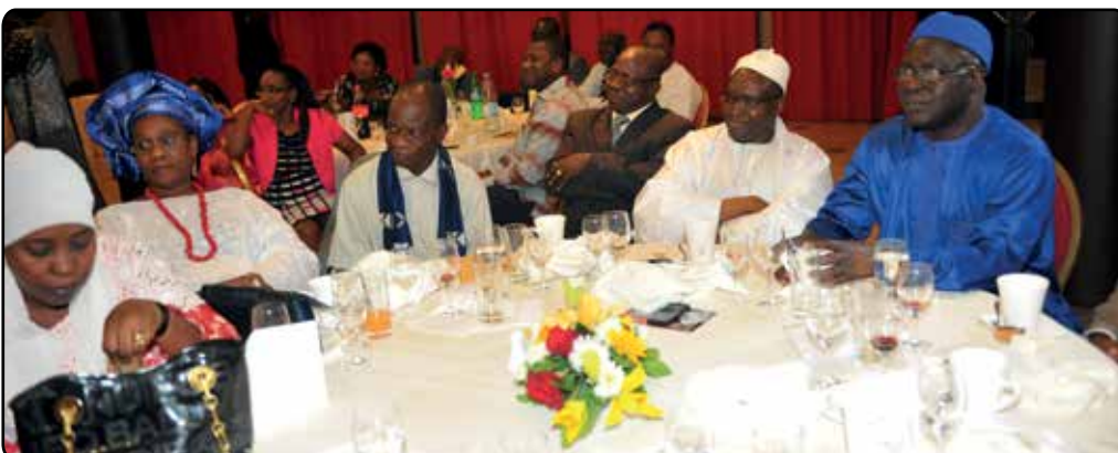
La table d'honneur du Diner de gala avec le Premier Président de la Cour des Comptes du Sénégal ( en bonnet bleu), le Président de la Cour des Comptes de l'UEMOA ( en bonnet blanc) et d'autres invités de marque